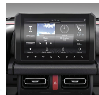
نظام عرض الصوت Display Audio