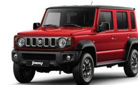
أحمر/أسود Red Metallic + Black Pearl (E5R)