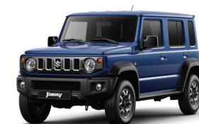
أزرق Blue Pearl Metallic (WBH)