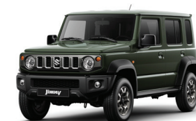
أخضر Jungle Green (WA7)