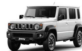
أبيض Arctic White Pearl (ZJH)