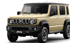
بيج/أسود Ivory Metallic + Black Pearl (E5J)