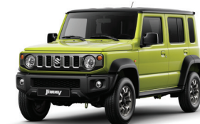
أصفر/أسود Kinetic Yellow + Black Pearl (E5H)