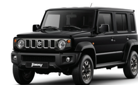
أسود Blush Black Pearl (WB3)