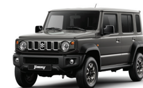
رمادي Granite Gray Metallic (ZTN)